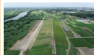
2. 渡良瀬川での堤防工事の完成写真