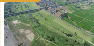
1. 利根川での堤防工事の完成写真