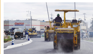
2. 壬生町コストコ周辺道路