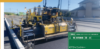
1. 筑西幹線道路ICT施工状況