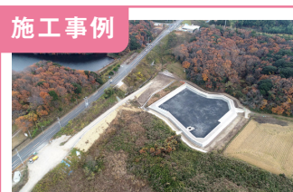
1. R4東関東道島須地区改良工事