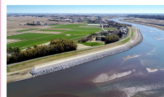
2. R4小貝川上平柳低水護岸工事