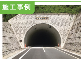
1. 十国トンネル本体工事