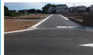
2. 守谷市松前台四丁目2 期住宅団地造成工事