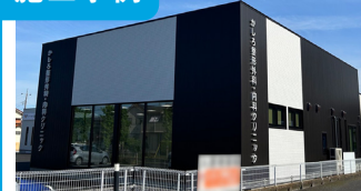
1. K 様整形外科クリニック新築工事