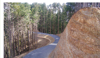
2. 関沢・舟生林道新設工事