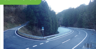
1. 31国補地道道路改舗装工事