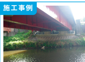
1. 園部新橋耐震補強工事