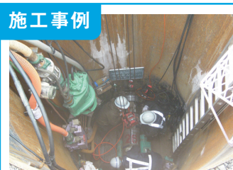
1. 河和田公共下水道推進工事