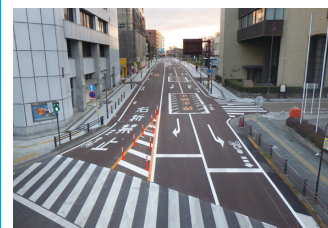
2. 三の丸道路舗装工事