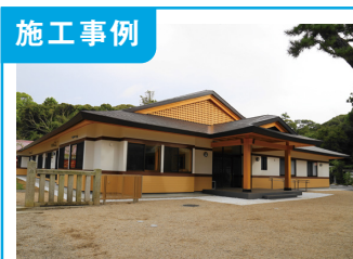
1. 「大洗磯前神社」社務所