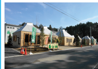
2. 「ソロー茨城」体感ルーム