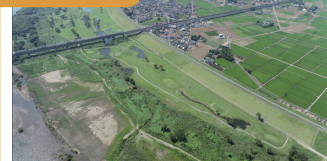
1. 利根川での堤防工事の完成写真