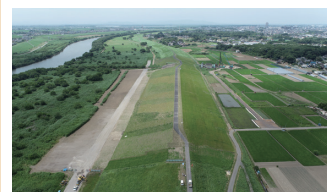
2. 渡良瀬川での堤防工事の完成写真