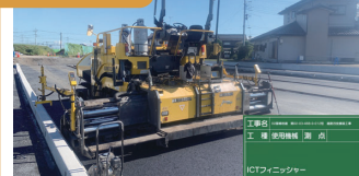
1. 筑西幹線道路ICT施工状況