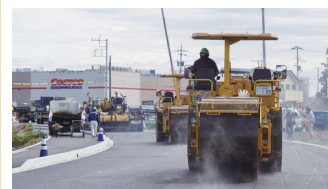
2. 壬生町コストコ周辺道路