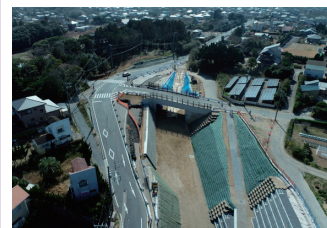
2. 荒井行方線 道路改良工事(その3)