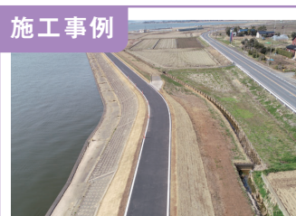
1. 北浦堤防整備工事