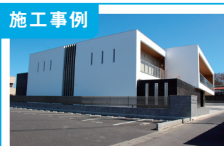
1. K 様邸新築工事