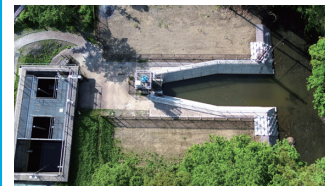
2. R3 霞ヶ浦導水桜機場周辺整備工事