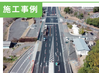
1. 大宮土木道路改良