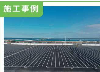
1. 常陸那珂港区 関連用地整備工事