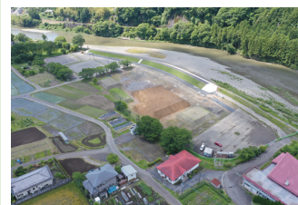
2. 久慈川周辺整備工事