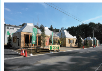
2. 「ソロー茨城」体感ルーム