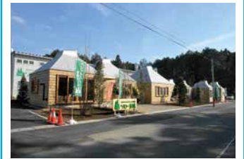
2. 「ソロー茨城」体感ルーム