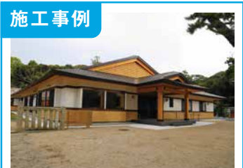
1. 「大洗磯前神社」社務所