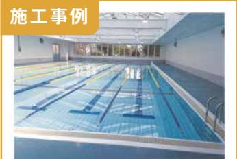
1. 関城中学校 屋内プール建築工事