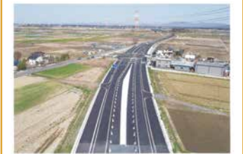
2. 県道筑西三和線 結城バイパス工事