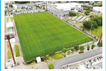
2. 市立サッカー場天然芝張替工事