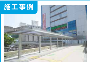
1. 水戸駅北口駅前広場改修工事